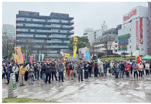
雨の中、警固公園に集まる参加者

福岡県総がかり実行委員会が主催するLOVE&PEACE平和のつどいが3月24日、警固公園で開催されま