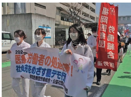
千鳥橋病院から千代地域をシュプレヒコールでデモ行進

3月14日、福岡医療団労働組合は、産別統一行動として、1時間の昼休みデモ行動と対政府ストライキを行いました。昼休みデモは労使と協力協同の取り組みと位置づけ、さら