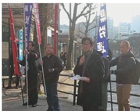
福岡中央郵便局前でスト決行

郵政ユニオンは24春闘において、物価上昇に見合う賃上げ、ベア30000円と非正規社員の最賃引き上げを最低1500円と正社員並みの最賃引き上げとする等を要求し、会