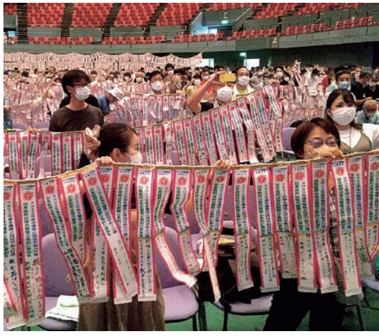
広島宣言を全国から集まったペナントで採択